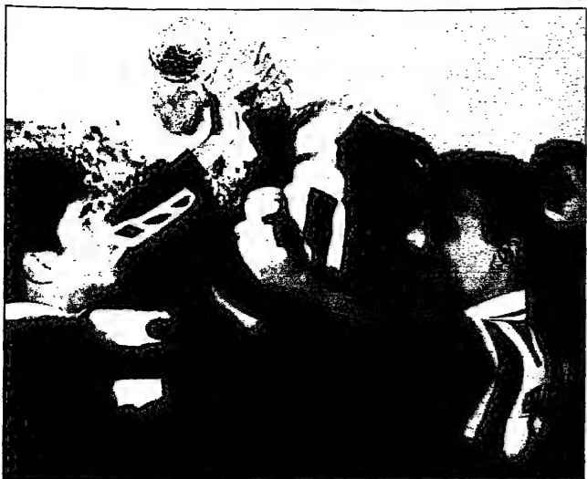
أسماء فريق الصناديق التونسية يتدربون ويحللون ألعاب الاتحاد الإفريقي (رويتز)